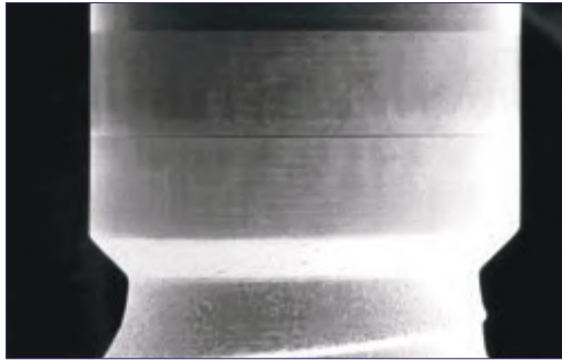
図1(A) レーザーマイクロテクスチャーを付与したインプラント表面の走査電子顕微鏡 (SEM) 画像。2mm 幅のカラー部分にマイクロテクスチャーが2層。(B) 12 \mu mの溝および山を示したレーザーマイクロテクスチャー表面の高倍率SEM画像。(目盛= 40 \mu m)